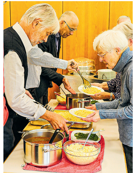
Sich informieren, spenden und geniessen: Am Spaghetti-Plausch wurde über zwei neue Projekte informiert