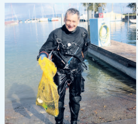
Taucher im Einsatz für einen sauberen See.

Am Romanshorer See-Clean-Up vom 2. November 2019 wurden 140 Kilogramm Abfall gesammelt. Das Tauchteam und Freunde der Tiefenstein Unterwasserwelten reinigten den See mit rund 30 Tauchern von Unrat. An Land standen nochmals 20 Personen im Einsatz. Ihre "Beute": Kochutensilien, eine elektrische Zahnbürste, Flaschen, Gläser, Besteck, Eimer und Besen, Signalisationsschilder und Metallträger im Wasser sowie Schuhe, Hosen, Büchsen und Dosen an Land. Heisse Marroni und feiner Punsch wärmten die kalte Hände der Helferinnen und Helfer. Herzlichen Dank allen! ●