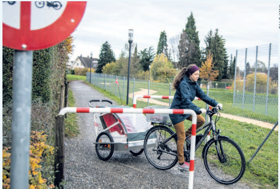
Problemlos Platz auch für breitere Gefährte: Schranke an der Weitenzelgstrasse.

Die Massnahme wird als Versuchsbetrieb geführt und von der Verkehrskommission der Stadt begleitet, die in einer der nächsten Sitzungen über die zeitliche Dauer befinden wird. Thematisiert werden sollen darüber hinaus in einer Gesamtbetrachtung mögliche ähnliche weitere Massnahmen auf dem Stadtgebiet zugunsten