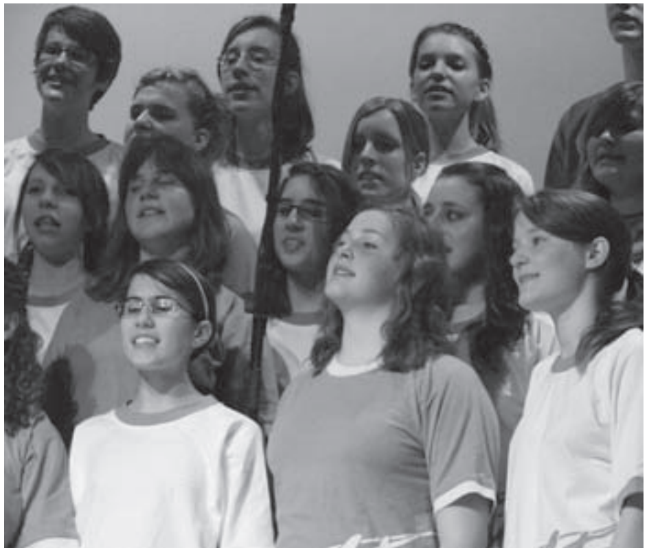
Ein Adonia-Teens-Chor in Aktion: Zum Jubiläum wurden die besten Songs aus 30 Jahren vorgetragen.