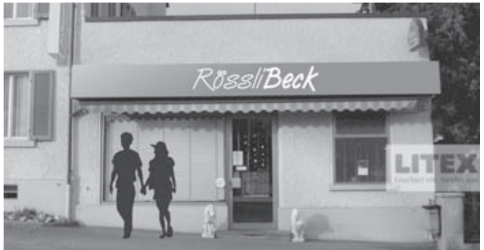
Fotomontage RössliBeck, Bahnhofstrasse 43