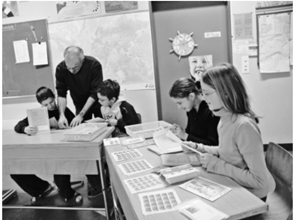
Mit viel Elan sind die Sechstklässler an der Arbeit und unterwegs für pro juventute.

Pro juventute versteht sich als Lobby für die Kinder in Romanshorn und Umgebung: Das Elternforum versteht sich als Plattform von und für Eltern. Vom Ferienpass profitieren un-